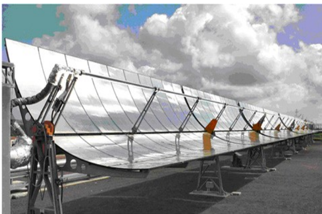
Impianto PCS per prova componenti solari (Centro Ricerche ENEA Casaccia)

L'umanità deve imparare a vivere in modo sostenibile e la scuola, come luogo di formazione, è il soggetto principale di questa nuova missione educativa.